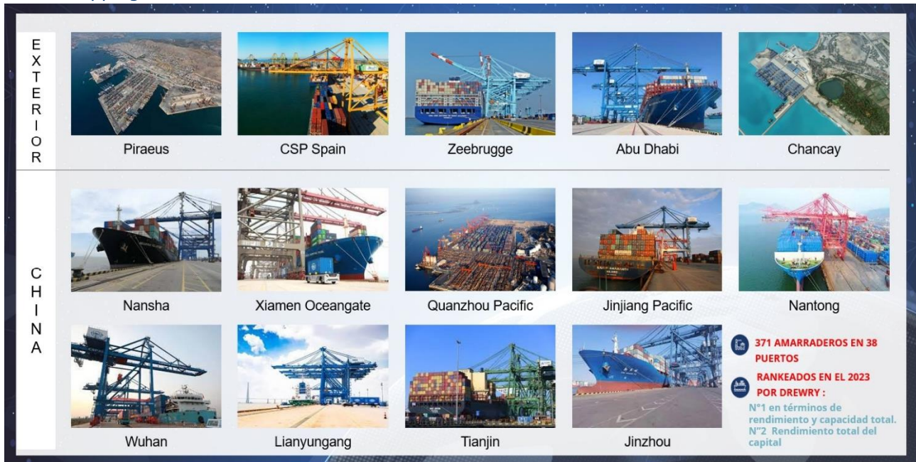
Figura 1: Cosco Shipping Ports